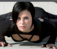
DVD Aeon Flux im Handel erhältlich Paramount Home Entertainment

Seit 1912 spielen Träume in Babelsberg die Hauptrolle. Auf dem größten und ältesten Mediengelände Europas, gelegen zwischen dem Berliner Wannsee und Schloss Sanssouci, wurden bereits über 3.000 Kino- und Fernsehfilme produziert. Marlene Dietrich begründete mit „Der blaue Engel“ ihren Weltruhm, Stars wie Greta Garbo, Heinz Rühmann und Hans Albers standen in Babelsberg vor der Kamera, Fritz Lang schrieb mit „Metropolis“ Kinogeschichte – sie alle liebten die Atmosphäre, den Charme und das Flair von Babelsberg.